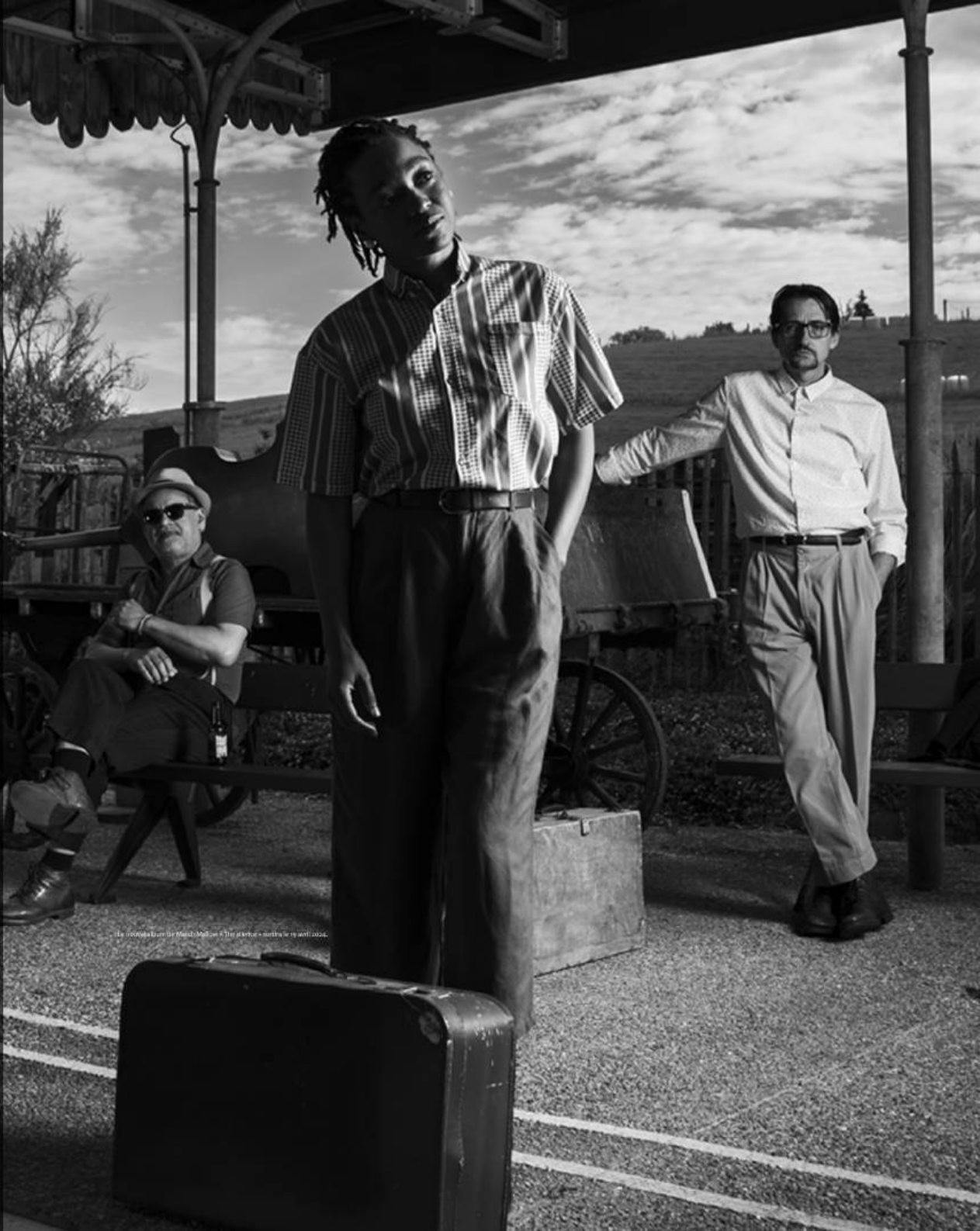
Le nouvel album de March Mallow « The silence » sortira le 19 avril 2024.