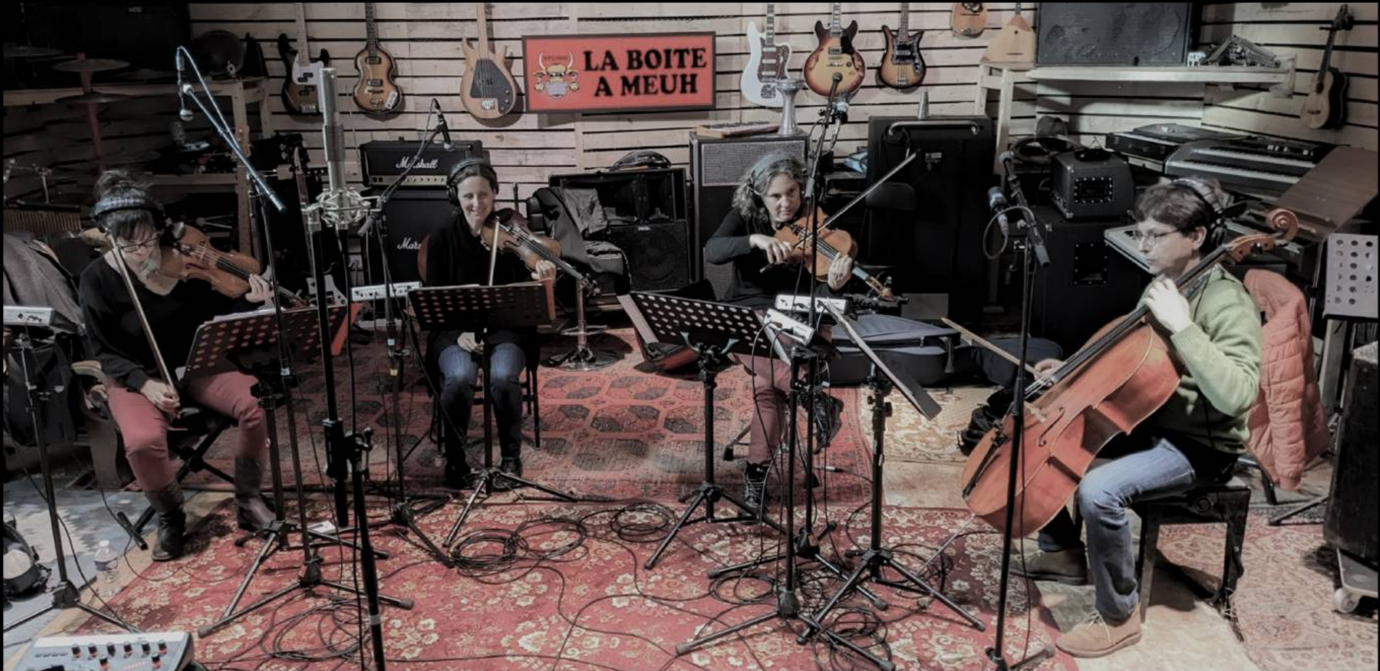
Le quatuor à cordes Yule est originaire de Poitiers. Il puise son répertoire dans les oeuvres classiques et baroques