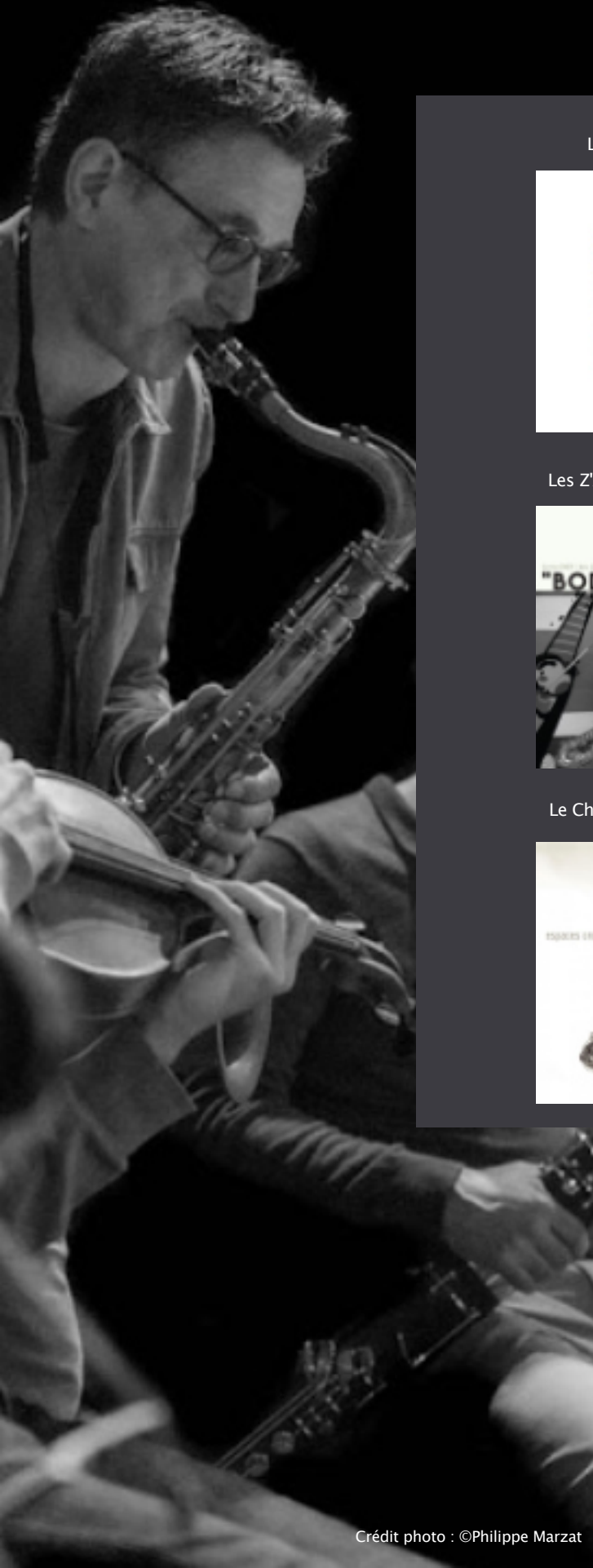
« Résonances » Laborie Jazz – 2021