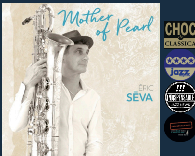
« Mother of Pearl » Les Z'Arts de Garonne – 2020