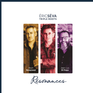
« Résonances » Laborie Jazz – 2021