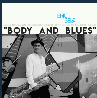
« Body and Blues » Les Z'Arts de Garonne – 2017