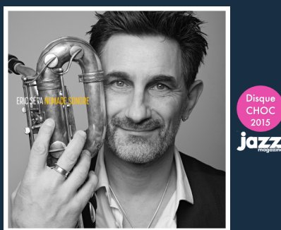
« Nomade Sonore » Gaya – 2015