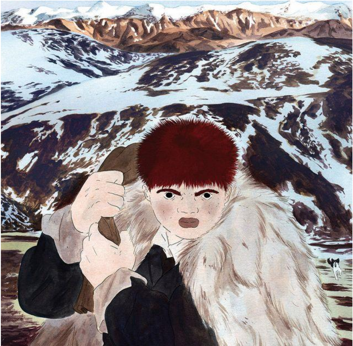
Détail de la couverture de la Saga de Grimr de Jérémie Moreau